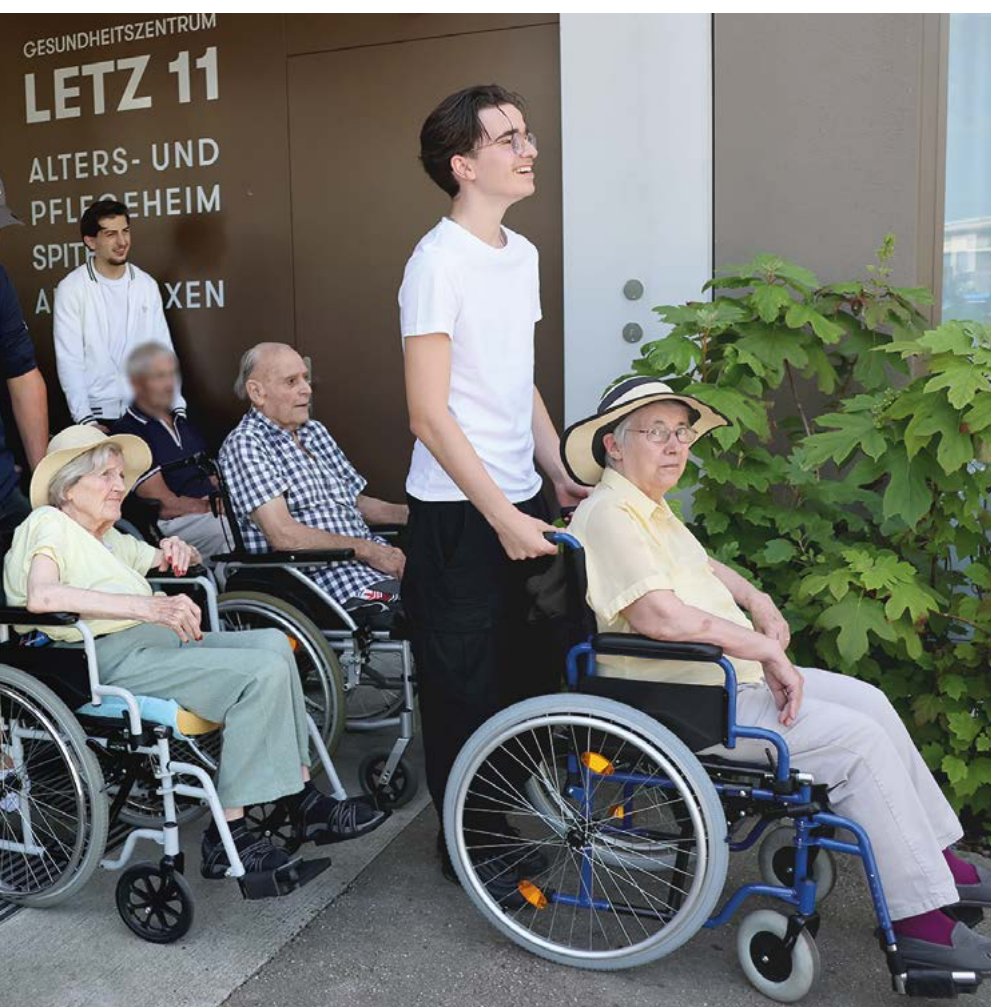
Die KV- und Forstwart-Lernenden der Gemeinde Glarus Nord gehen mit den Bewohnenden des Alters- und Pflegeheims «Letz» in Näfels spazieren.

Ein kleines, aber wirkungsvolles Zeichen dafür setzten die Lernenden der Gemeinde Glarus Nord beim diesjährigen Lehrlingsausflug am 13. Juni 2025. Die KV- und Forstwart-Lernenden verbrachten Zeit mit den Bewohnerinnen und Bewohnern des Alters- und Pflegeheims Letz in Näfels.