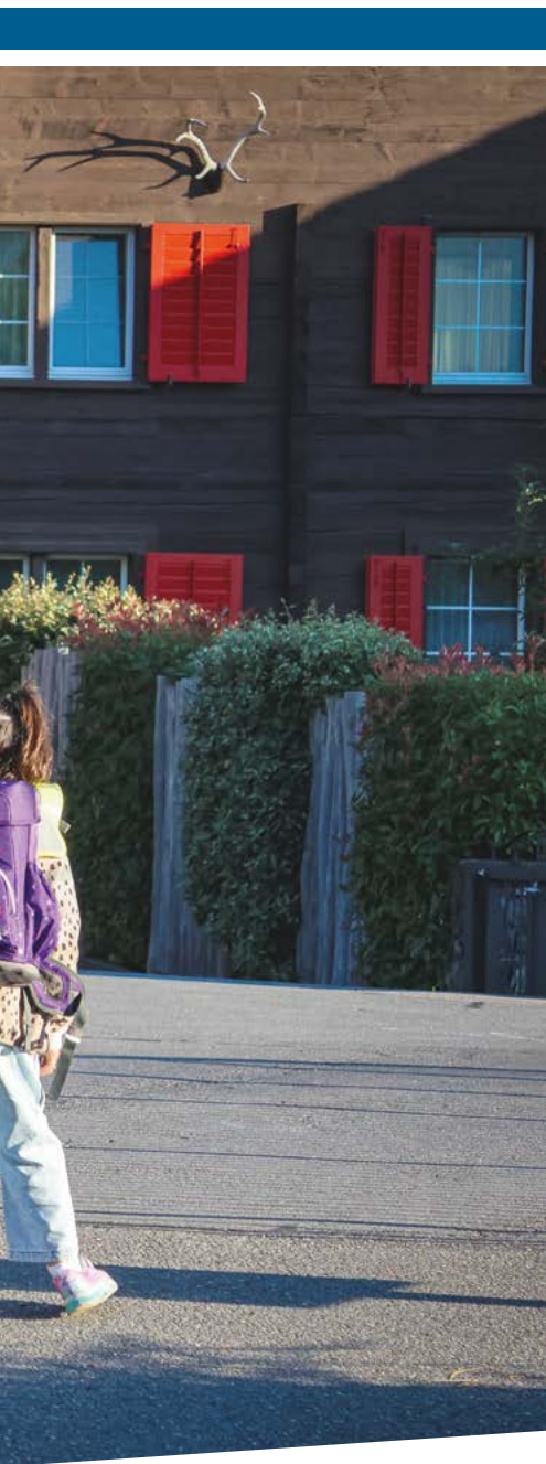
Einkaufen, Wohnen, Arbeiten: Glarus Nord hat viel zu bieten.