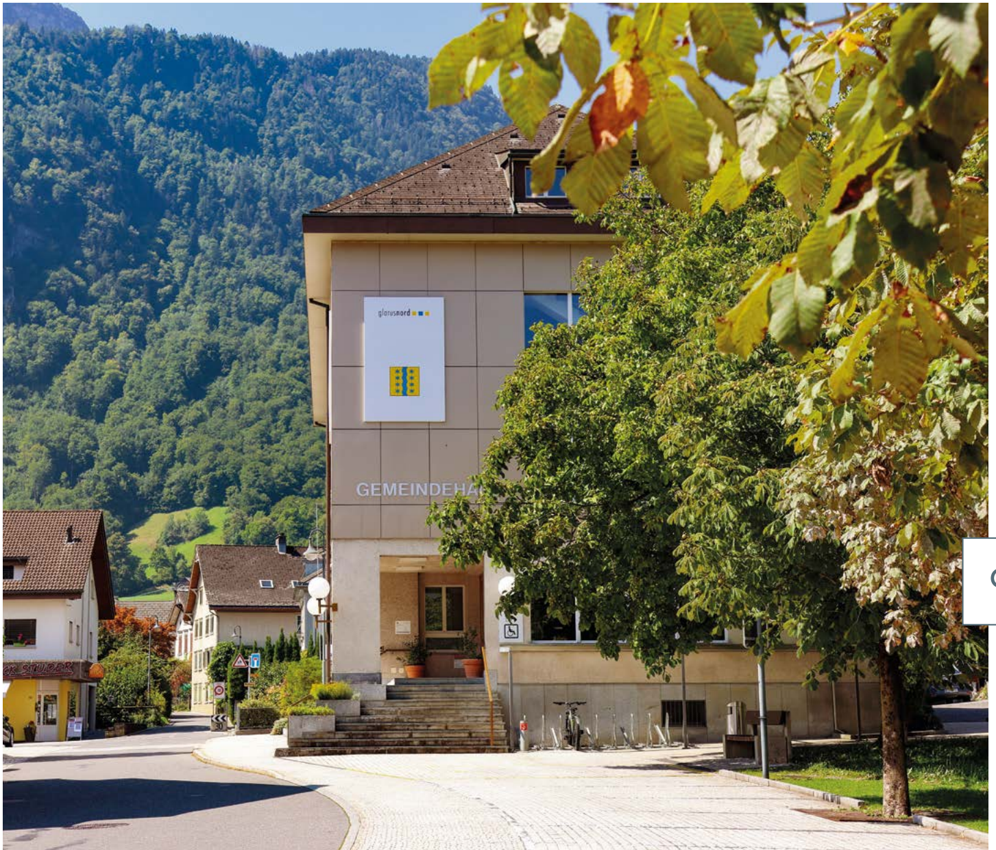
Die Steuerentwicklung pro Kopf ist ein klares Signal für die gesunde wirtschaftliche Entwicklung der Gemeinde.

net Chancen, verlangt aber zugleich eine verantwortungsbewusste Finanzpolitik. Denn mit steigenden Bevölkerungszahlen gehen auch Investitionen in die Infrastruktur einher. Werden diese im richtigen Verhältnis zu den Mehreinnahmen geplant, bleibt Glarus Nord langfristig finanziell unabhängig, handlungs- und zukunftsfähig. Das allein reicht noch nicht. In den nächsten Jahren müssen wir mit klugen Ansiedlungen die finanzielle Handlungsfähigkeit und Unabhängigkeit von Kreditgebern für zukunftsorientierte Investitionen sichern. ■