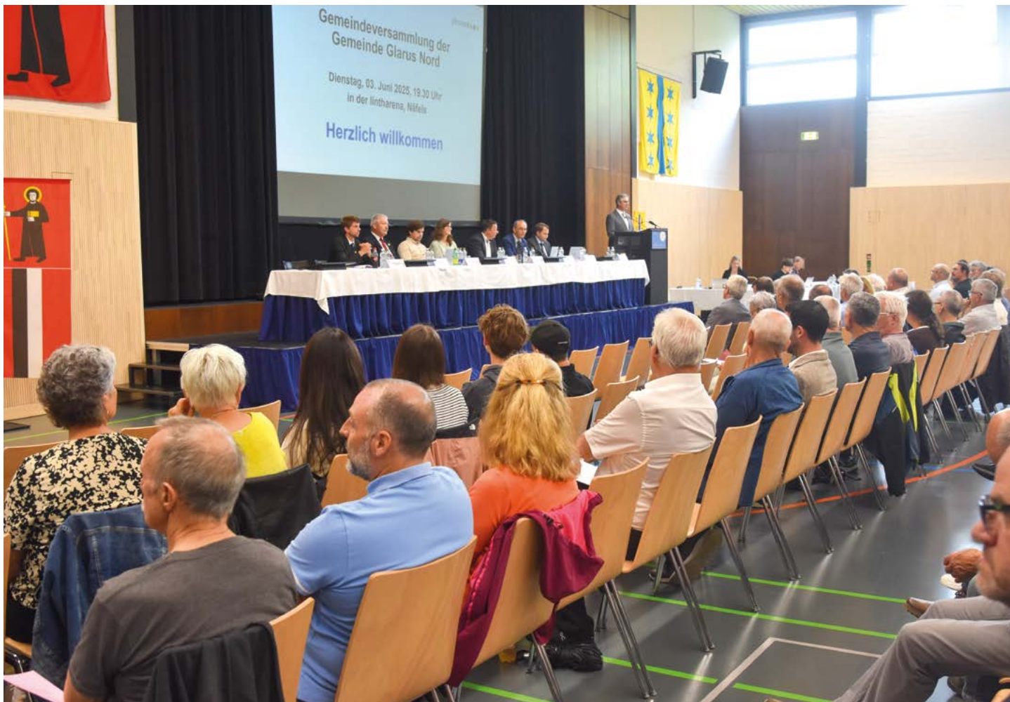
Sie bestimmt den Steuerfuss: Die Gemeindeversammlung in Glarus Nord.

Die Bevölkerungszahl in Glarus Nord steigt seit Jahren kontinuierlich. Mit dem Wachstum verändert sich nicht nur die soziale und räumliche Struktur der Gemeinde, sondern auch ihre finanzielle Basis. Insbesondere die Entwicklung der Steuereinnahmen pro Kopf zeigt, wie stark sich der demografische Wandel auf die Gemeindefinanzen auswirkt.