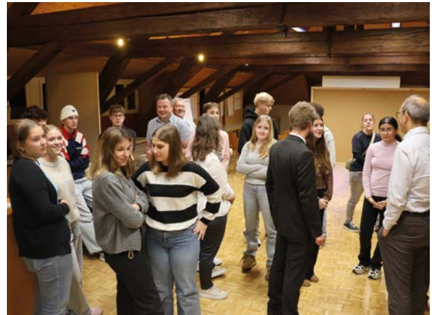
...interaktiven Übungen rund ums Mitreden und Mitgestalten auch die Anliegen der jüngsten Stimmberechtigten zum Vorschein.