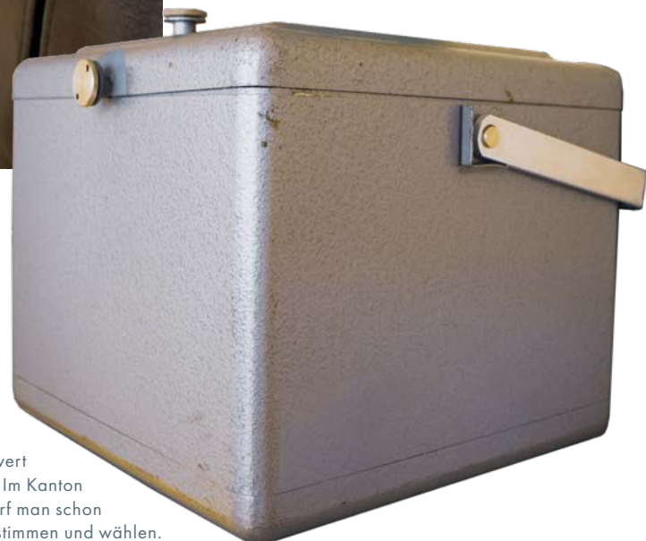
Stimmcouvert und Urne: Im Kanton Glarus darf man schon mit 16 abstimmen und wählen.

Die Schweiz gilt weltweit als Musterbeispiel direkter Demokratie. Nirgendwo sonst können Bürgerinnen und Bürger so unmittelbar über politische Fragen entscheiden – nicht nur auf nationaler Ebene, sondern vor allem dort, wo Politik am nächsten am Alltag ist: in der Gemeinde.