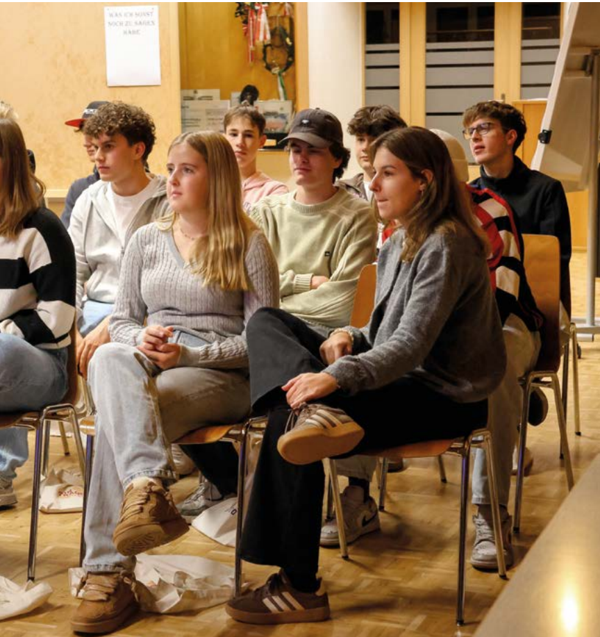
Rede vom Gemeindepräsidenten kamen bei einer Podiumsdiskussion mit dem Gemeinderat und...