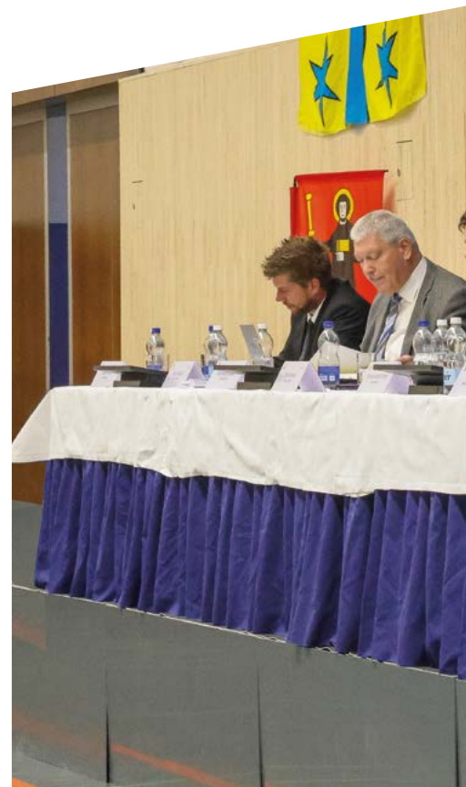
Davon lebt die Gemeindeversammlung: Wortmeldungen

Bevor ein Geschäft überhaupt auf die Traktandenliste gelangt, durchläuft es einen klar strukturierten Prozess. Themen entstehen in der Verwaltung, im Gemeinderat oder aus der Bevölkerung. Die Verwaltung erarbeitet daraufhin die gesamte Vorlage: Sie recherchiert, klärt rechtliche und fachliche Fragen, holt nötige Abklärungen ein und erstellt die Unterlagen.