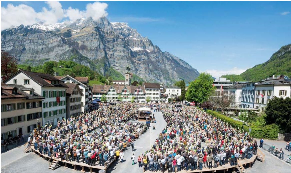
Die Landsgemeinde ist die Versammlung der stimmberechtigten Glarnerinnen und Glarner und oberstes Organ des Kantons.